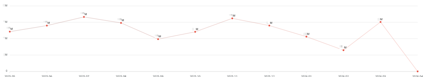
Zakupy wg magazynu w ostatnich 12 miesiącach

„Zakupy wg magazynu w ostatnich 12 miesiącach” – wykres prezentuje wartość zakupów w ujęciu miesięcznym , z rozróżnieniem na poszczególne magazyny. Dzięki temu można śledzić, jak zmieniały się zakupy w czasie i które magazyny generowały największe wydatki.